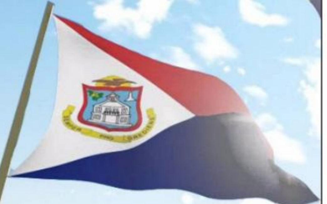
CORSOU ST. MAARTEN